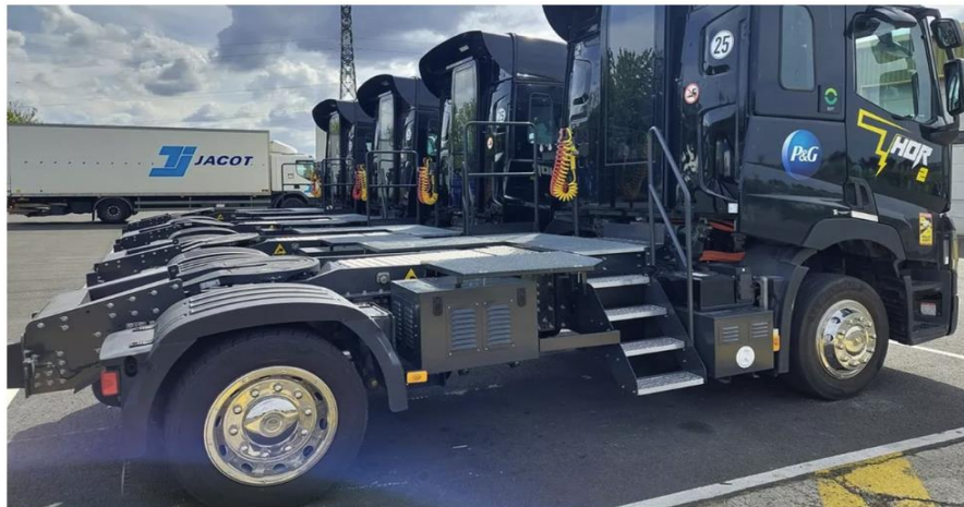
Pour trouver les camions à modifier, Neotrucks s'est associé au constructeur Renault Trucks. (DR)

Les jardinerie Botanic ouvrent pour la première fois leur capital